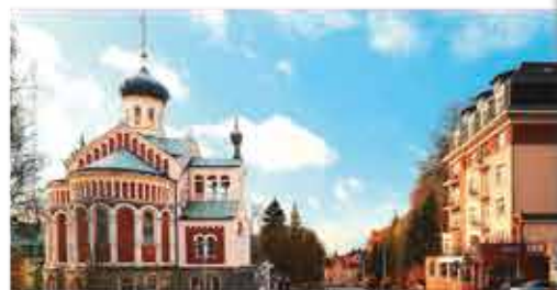
Außenansicht, 4+ Hotel Richard

Freizeit/Kur/Unterhaltung: Als Gast des Hotels stehen Ihnen ein Rehabilitations-Schwimmbekken (9 x 4 m, ca. 28°C) und ein Whirlpool außerhalb der Therapiezeiten zur freien Verfügung. Im Fitnessraum des Hotels können Sie sich aktiv betätigen. Oder Sie lassen es sich im Rehabilitationszentrum bei klassischen und speziellen Marienbader Kur-Anwendungen gut gehen. Auch kosmetische Behandlungen, wie Hand- und Fußpflege können gegen Gebühr in Anspruch genommen werden.