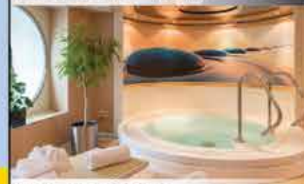
Whirlpool, 4++ MAXIMA