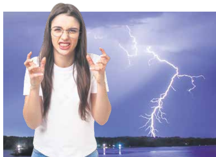
Fotos: Ivan Kurmyshov, Mix and Match Studio / Adobe Stock; Montage: SoVD

Der Glauben bestimmte damals den Alltag der Menschen in allen Bereichen. Sie waren selbst beim Schimpfen darauf bedacht, keine Gotteslästerung zu begehen. Schließlich warnt bereits das zweite Gebot davor, den Namen des Herrn zu missbrauchen. Und so setzte sich recht schnell die sogenannte Hüllformel „potz“ durch.