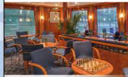
Panorama-Salon, 4++ MAXIMA