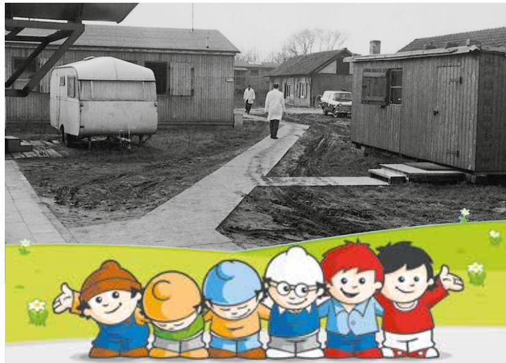
Foto: Georg Meyer-Hanno / ZDF; Grafik: Jan Langela / ZDF; Montage: SoVD

Zu den Räumen, in denen die ersten Sendestudios untergebracht waren, gehörten ein Bauernhof und ein ehemaliges Arbeitslagergebäude. Dies trug dem Gelände in Eschborn den Spitznamen „Telesibirsk“ ein. Recht bald jedoch erwarb der Sender von der Stadt Mainz ein repräsentatives Gelände auf