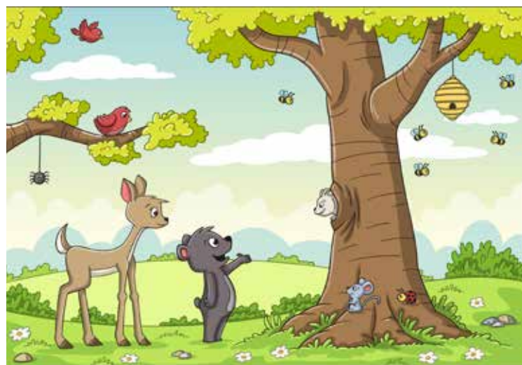
Grafik: GabiWolf/Adobe Stock

Mit dem Frühling setzt in der Natur wieder geschäftiges Treiben ein. Doch beim Treffen dieser Waldtiere ist etwas schiefgelaufen: Im unteren Bild haben sich zehn Fehler eingeschlichen – findest du sie? Die Auflösung kannst du dir auf Seite 18 anschauen.