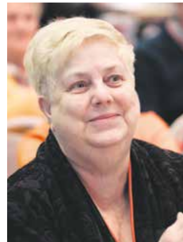
Jutta König ist seit 2019 Bundesfrauensprecherin im SoVD und gehört somit dem Präsidium an.