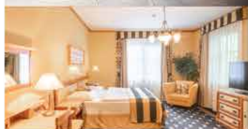
Zimmerbeispiel, 4+ Hotel Richard