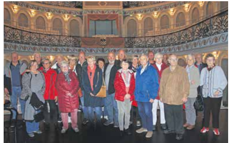
Die Gruppe im Putbuser Theater, das ein prachtvoller Bau ist.

Dann fuhr der Bus zu Drehorten des Films „Die Heiden von Kummerow“ von 1967. Fahrer Jan Dzarnowski erzählte Interessantes dazu. Mittagessen gab es im Theater – und als „Nachtsch“ den Film, der Erinnerungen weckte. Nach Kaffee und Kuchen ging es zurück nach Rostock.