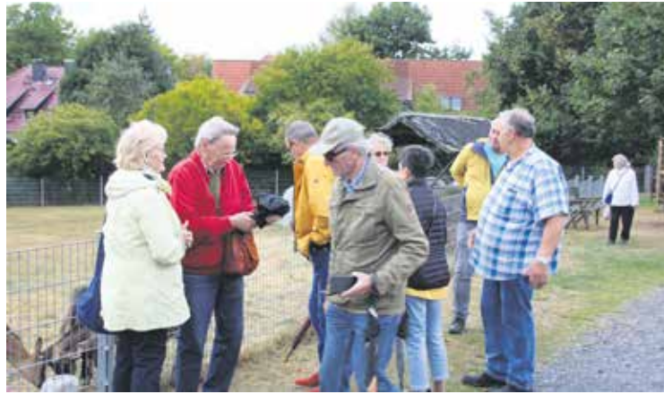
Die Gruppe des SoVD Quedlinburg erkundete ausgiebig das Gelände der Ziegenalm.