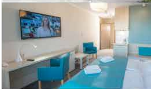
Zimmerbeispiel, 3+ Aparthotel Nad Parseta

Beratung & Buchung: 0800 - 228 42 66 gebührenfrei / Mo.-Fr.: 9-17 Uhr