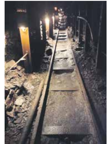
Die engen und dunklen Stollen sind nichts für Menschen mit Platzangst.

Nach dem Besuch des Stollens ging es auf die Ziegenalm „Sophienhof“. Bei einem gemeinsamen Kaffeetrinken wurden die Erlebnisse und Eindrücke des Tages ausgewertet. Mit Zwischenstopp an der Stabkirche ging es wieder zurück nach Wernigerode. Das Feedback der