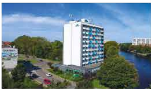
3+ Aparthotel Nad Parseta