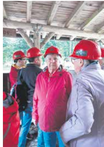
Gut behelmt führen die Gäste aus Wernigerode hinunter in die Steinkohlegrube.

Mit dem traditionellen Bergmannsgruß „Glück Auf“ begann die Erlebnisfahrt im Rabensteiner Express in eine einzigartige Welt unter Tage. Die Tour im Stollen gleicht einer Zeitreise durch die fast 300-jährige Geschichte des Harzer Steinkohlebergbaus. Bei der Grubenführung konnten die Besucher*innen letzte Reste der Steinkohle, interessante Fossilien, authentische Arbeitsorte und zahlreiche Abbaustrecken sehen, die oft nur 60 Zentimeter hoch sind. Auch kamen Maschinen vor Ort zum Einsatz und man begann zu ahnen, welche Entbehrungen es gekostet haben mag, dem Berg ein wenig Steinkohle abzurufen. Solche Arbeitsbedingungen kann man sich heute kaum noch vorstellen. Die besondere Atmosphäre unter Tage war für alle eine eindrucksvolle Erfahrung.