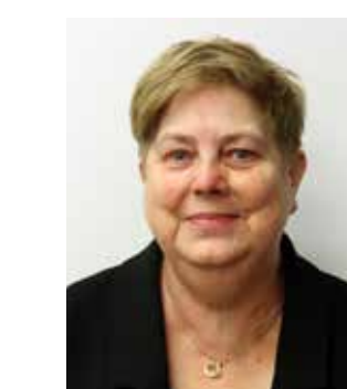
Jutta König Bundesfrauensprecherin

In erster Linie pflegen Frauen Angehörige. Eine Entgeltersatzleistung für Pflegezeiten mindestens in Höhe des Elterngeldes kann Nachteile im Beruf abwenden. Für Männer wäre es