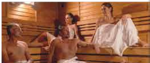
Sauna, 4+ Resort Reitenberger

Freizeit/Kur/Wellness: Das Resort besitzt eine Kurabteilung mit Schwimmbad (9 x 6 m, ca. 29°C), Whirlpool, Saunabereich mit Dampfbad und einem Fitnessraum (kostenfrei außerhalb der Therapiezeiten). Zudem verfügt das Haus über eine Salzgrotte (gg. Gebühr).