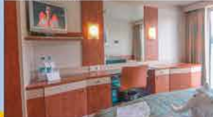
Kabinenbeispiel, 4+ DCS Amethyst