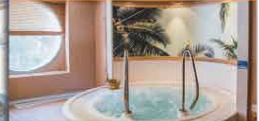
Whirlpool, 4+ DCS Amethyst

Beratung & Buchung: 0800 - 228 42 66 gebührenfrei / Mo.-Fr.: 9-17 Uhr