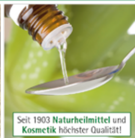
Entwicklung und Herstellung im eigenen Haus